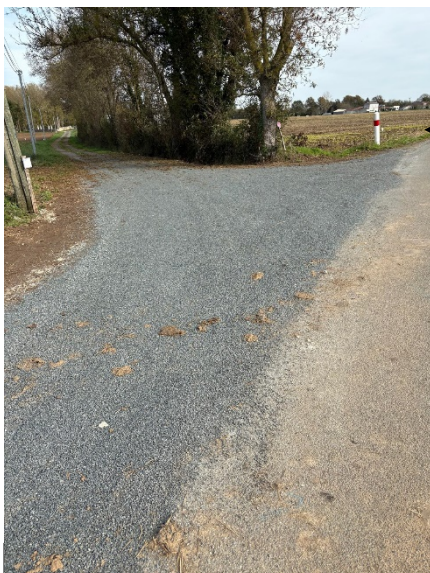
Carrefour route de Geay / Rue du château