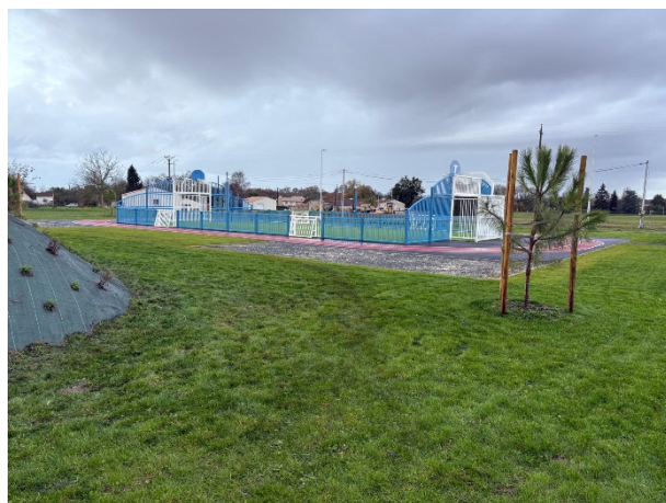
Engazonnement et plantations au city Park