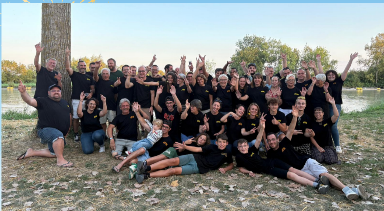
L'ensemble des bénévoles - édition 2025