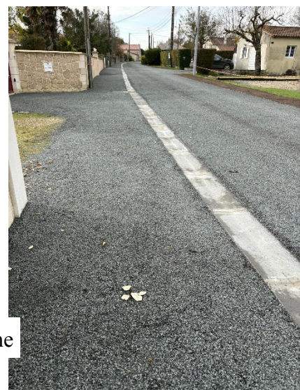
Chemin de la Planche