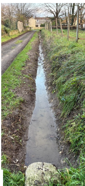
Impasse des Près