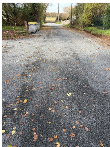
Chemin des Vignes