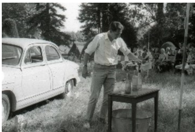
La kermesse au Château du Mung en 1964