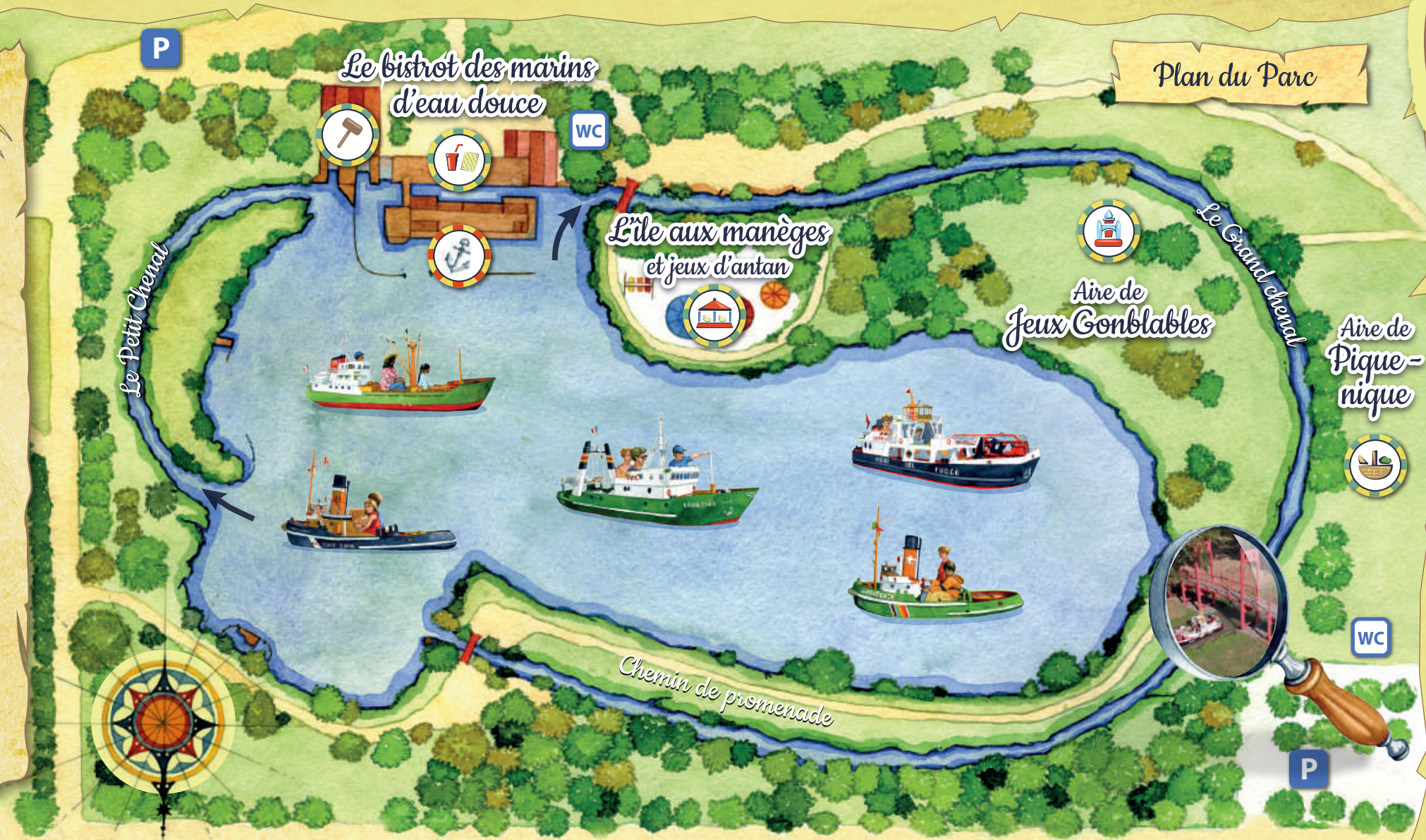
Plan du Parc