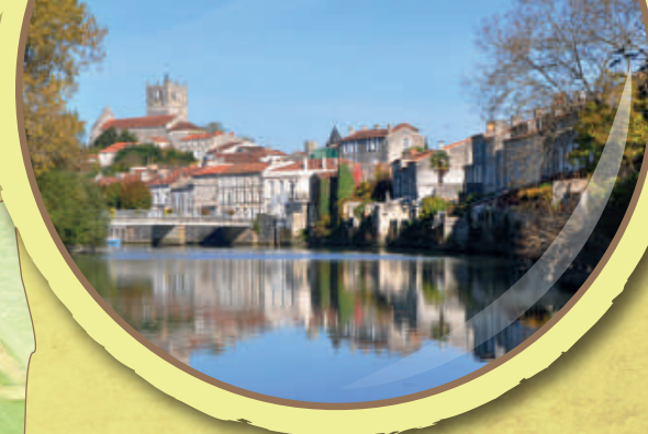
Saint-Savinien-sur-Charente Petite cité de caractère, village d'Artiste